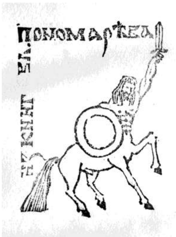
Экслибрис (автор В.А.Пономарёв)