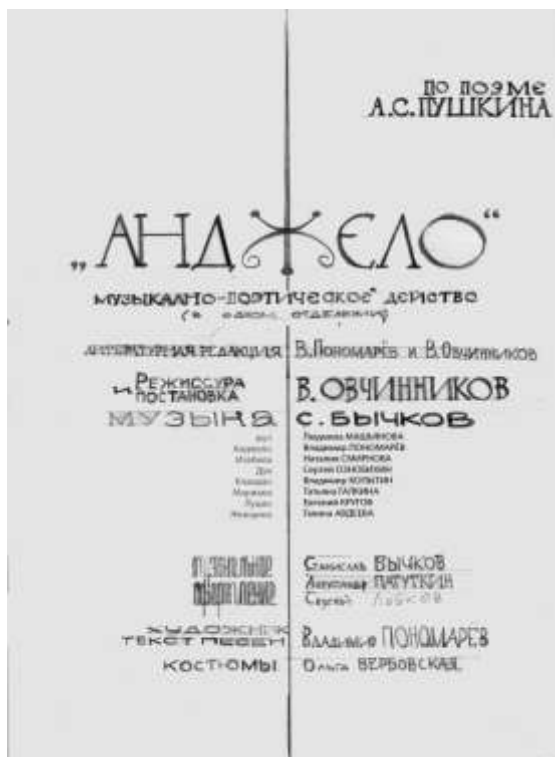
Эскиз афиши к спектаклю «АНДЖЕЛО»