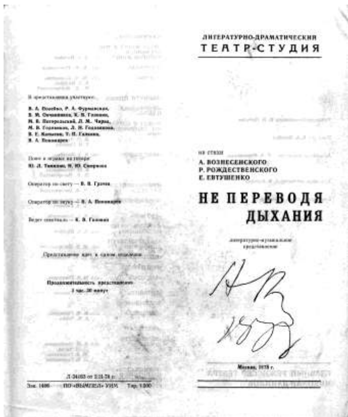
Программка к спектаклю «Не перевода дыхания» с автографом Андрея Вознесенского