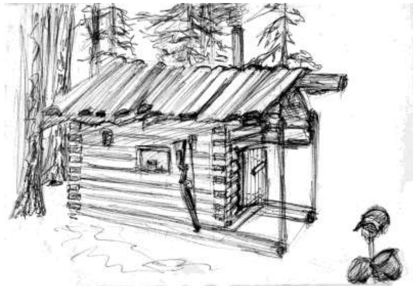
Охотничья избушка. Архангельская обл. 1994 г.