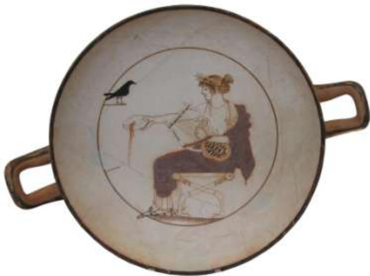
Блюдо из музея в Дельфах (на склоне горы Парнас)